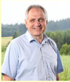
Bürgermeister Franz Heiderer