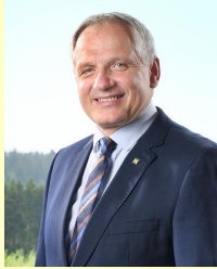
Bürgermeister Franz Heiderer