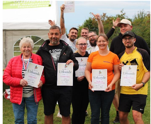
Platzierungen 9 bis 4: Lugendorf, Langschlag, Kleinnondorf/Wielands, Kleingöttfritz, Meierhofweg, und Grafenschlag

Der USC Grafenschlag bedankt sich herzlich bei allen freiwilligen Helferinnen und Helfern der einzelnen Sektionen, die mit ihrem Einsatz zum Gelingen dieses Festes beigetragen haben.