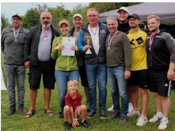
3. Platz Kaltenbrunn + Siedlung Kaltenbrunn