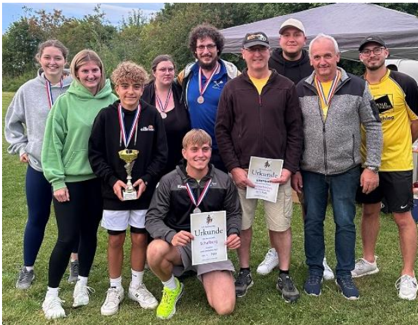
2. Platz Schafberg