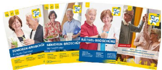
Die Broschüren und Ratgeber sind kostenlos!

Bewegungstipps und ausführliche Übungsanleitung für Mobilisation, geschmeidige Faszien, Gleichgewicht und Kraft